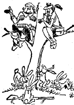
—Karulo, sed tio estas leporoj —Ili ne estas mia specialaĵo. Mi ĉasas nur tigrojn