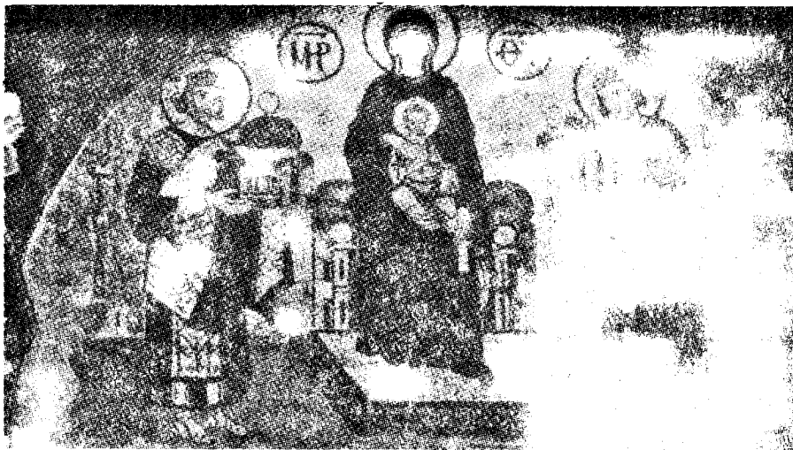
Murpentraĵo — reŝtariĝita artaĵa fresko en la preĝejo „Sankta Sofio“

Nia bulgara turista grupo vidis ankaŭ la ruinojn de la hipodromo, konstruita en 203 de Septimij Sever laŭ la modelo de la romia „Cirkus maksimum“. Nun tie ĉi estas la „Atmeĵdan“ (Ĉevalplaco). Tie ĉi en 1826 sultano Mehmed la Dua ruze alfris 30000 janiĉarojn (kristandevena