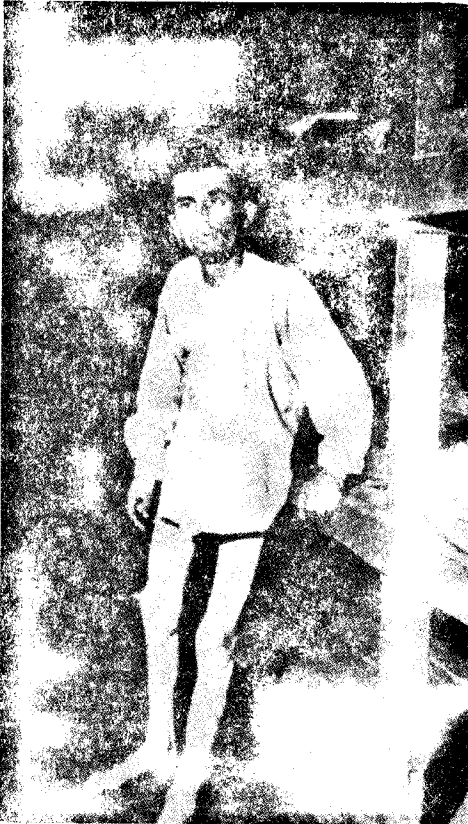
3. Mizerulo—viktimo de la naciistoj en la koncentrejo de Buchenwald.