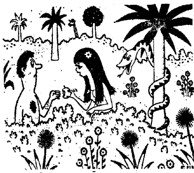
— Nu, prenu, Adamo. Vi bezonas vitaminon „C“

Fotografajoj de la Inaŭguro estas haveblaj laŭ peto.