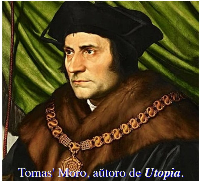
Tomas' Moro, aŭtoro de Utopia .

loĝloko ol tiam. Jes, nun ni havas pli bonajn higienon, medicinon, pli universaligitan