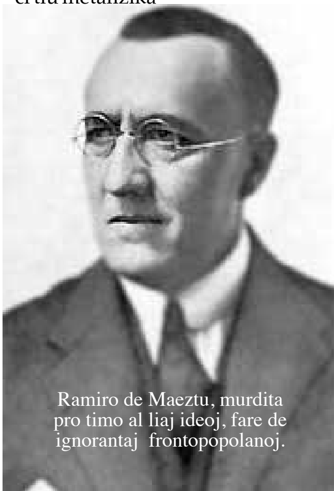
Ramiro de Maeztu, murdita pro timo al liaj ideoj, fare de ignorantaj frontopopolanoj.

Nia hispanisma senco diras al ni, ke iu ajn viro, kiel ajn falinta, povas leviĝi; sed ankaŭ fali, kiom ajn alta ĝi ŝajnas. En ĉi tiu ebleco fali aŭ leviĝi, ĉiuj viroj estas egalaj. Per ĝi eblas al Ganivet imagi sian diamantan akson aŭ kategorian imperativon: ke oni ĉiam povos diri pri vi, ke vi estas viro . La homo estas ŝipo, kiu ĉiam, dum ĝi flosas, povas rektigi sian vojon. Se la ŝipanaro neglektis ĝin, se ĝia kilo, veloj aŭ rigilaro estas en malbona stato, estos pli malfacile por ĝi elteni ŝtormojn. Rektigi la vojon ne sufiĉos atingi havenon. Sukceso estas de Dio. Kion la navigisto povas fari estas ŝanĝi direkton. En ĉi tiu metafizika