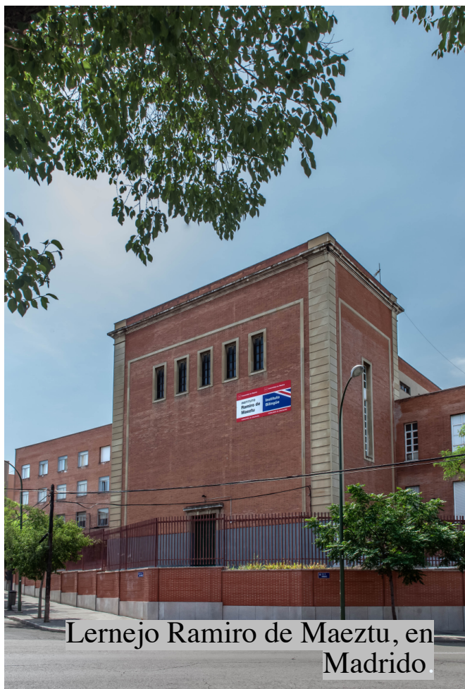
Lernejo Ramiro de Maeztu, en Madrido.